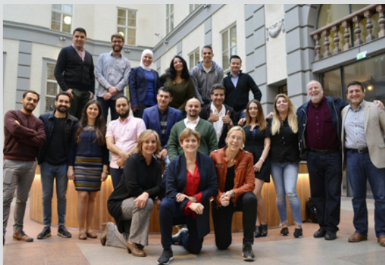
RAMP 2017 – deltagare och kursledning.