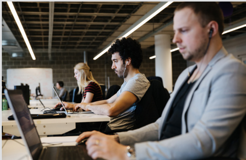
Interiör från det nya, moderna kontoret i A house.