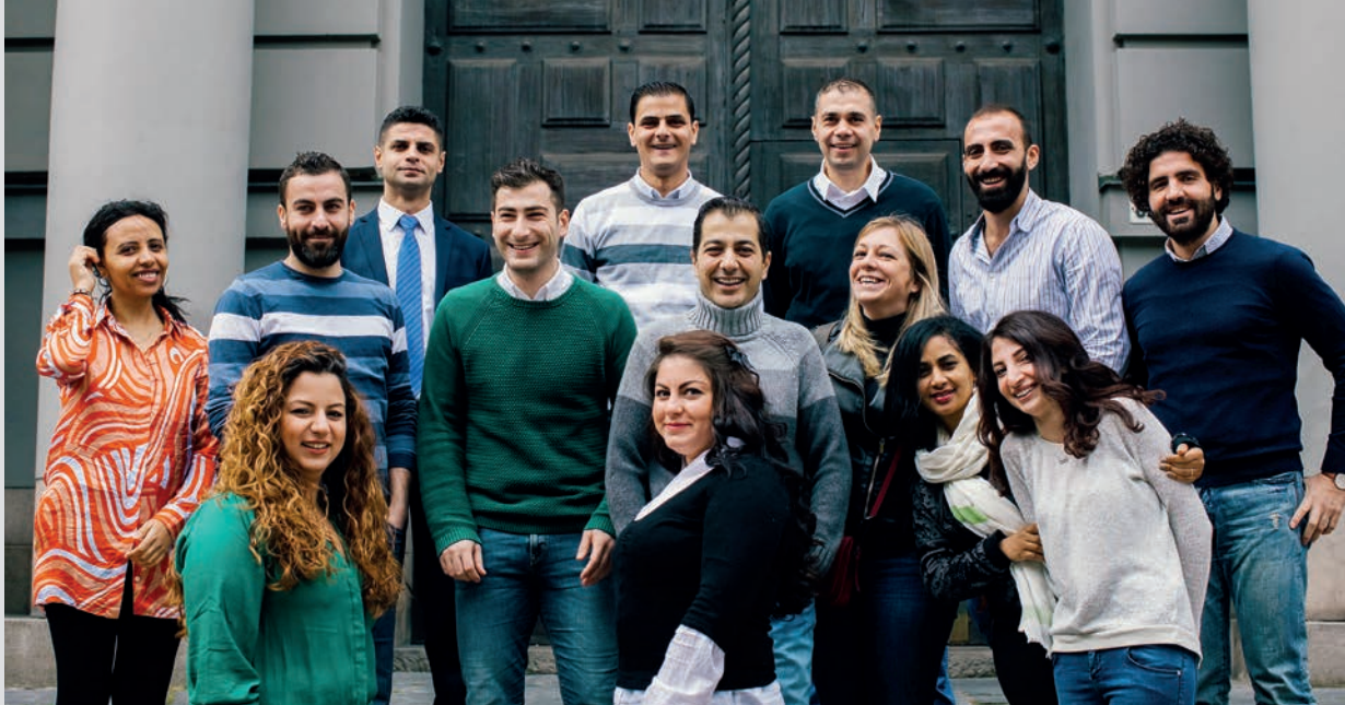
Första kullen RAMP-deltagare på Handelshögskolans trappa.