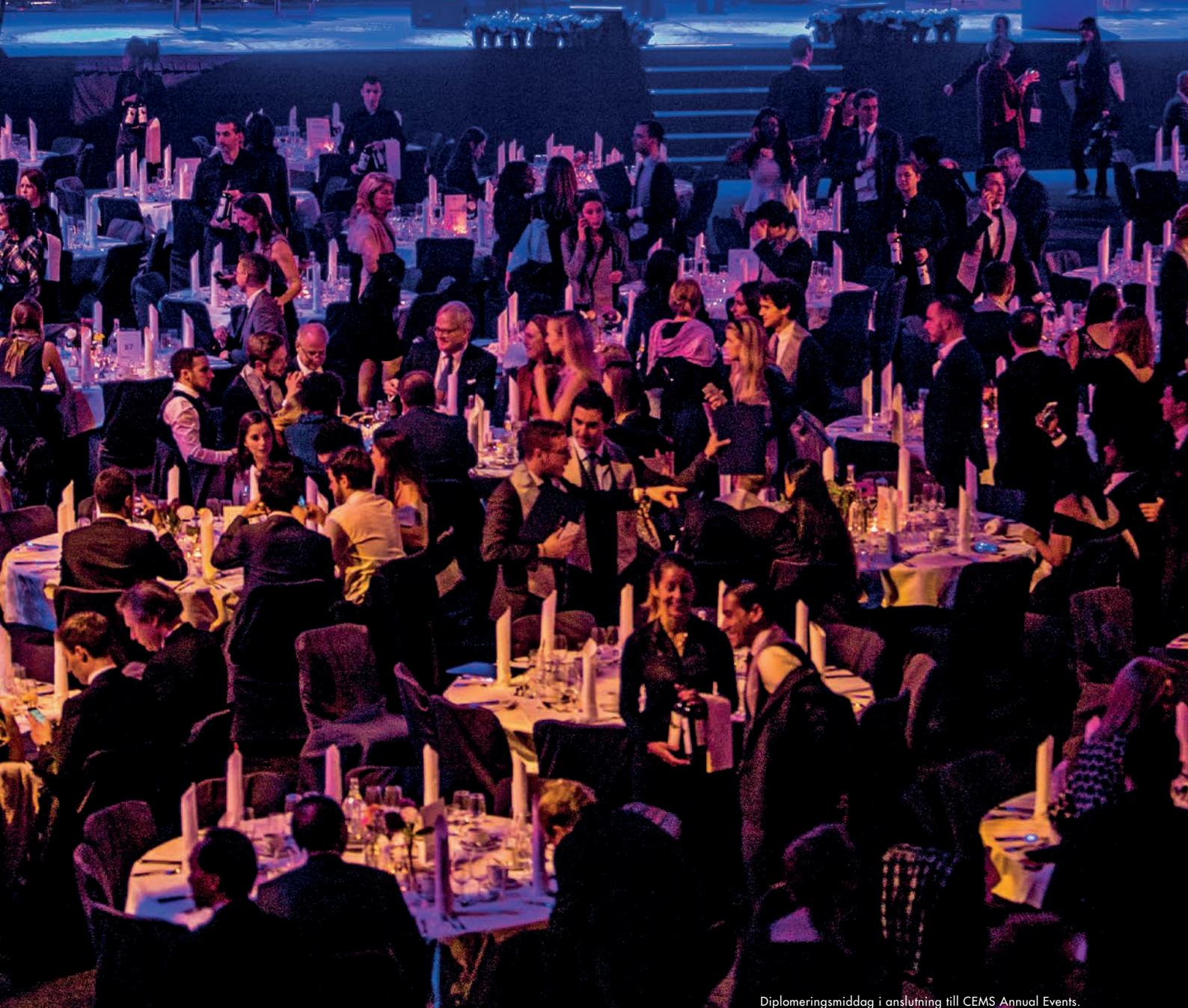
Diplomeringsmiddag i anslutning till CEMS Annual Events.