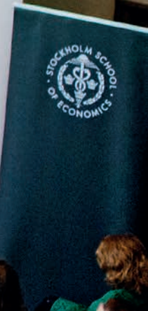
Johan Rockström, professor i miljövetenskap och föreståndare för Stockholms Resilienscentrum, föreläser inom ramen för Global Challenges.