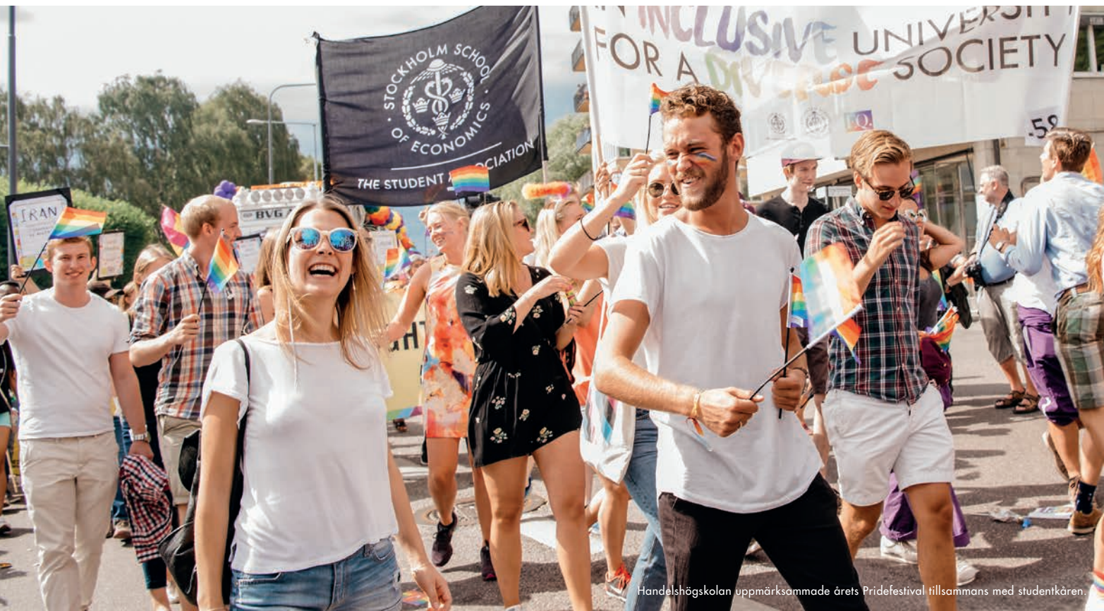
Handelshögskolan uppmärksammade årets Pridefestival tillsammans med studentkåren.

Ständiga förändringar behövs för att vi ska fortsätta vara en handelshögskola av världsklass. Under året har vi bland annat lanserat utbildningsspåret Global Challenges för kandidatprogrammet i Business and Economics, vi har intensifierat jämlikhetsarbetet och vi har beslutat att introducera ett alternativt urval för kandidatprogrammet för att nå studenter från en bredare rekryteringsbas.