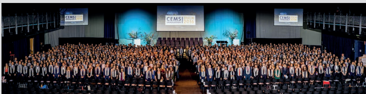
Förväntansfulla CEMS-studenter inför examensceremonin.