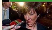
Socialdemokraterna samlades i dag i Stockholm efter katastrofvalet.