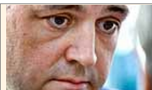
M backar i Reinfeldts hemkommun Täby.