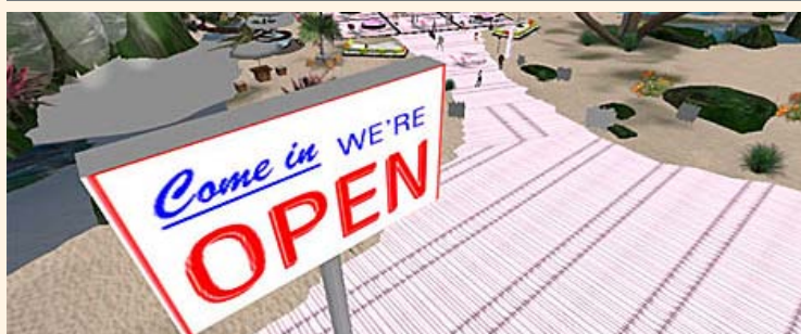
Bild från den virtuella världen Second Life. där en stor del av dagens avaprenörer driver sin verksamhet.