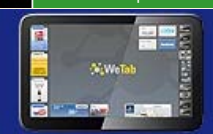
Tyska Wetab utmanar både Apple och Nokia.