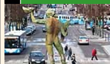
Frågan om trängselskatt rörde om valet i Göteborg.