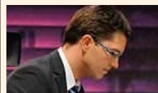
Jimmie Åkesson har träffat riksdagens talman.