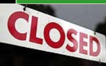
Hedgefondförvaltare lägger ned allt fler fonder