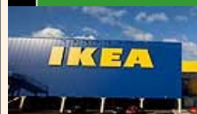
Ikeas försäljning fortsätter öka. Och nu ska möbeljätten in i Sydkorea.