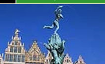
PENGAR24 Strunta i London, Rom och Paris. Här är höstens alternativa