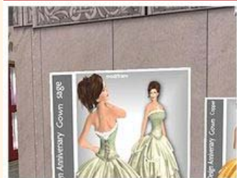
Virtuella modeskapare Second Life Entrepreneur of the Year år 2009 och grundare till ett av den virtuella världens mest välkända modeföretag. Det är Swaffette