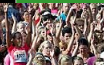
Enkelt men effektivt, det är träningstrenden i höst.