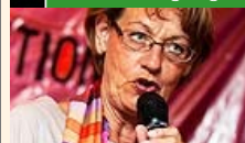
Feministiskt Initiativ blev tredje största parti i partiledarens hemkommun.